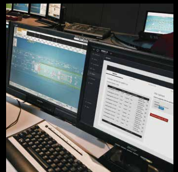
AV y Sala de Control