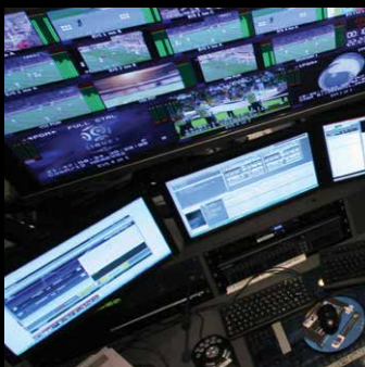
Conmutación matricial y extensión KVM