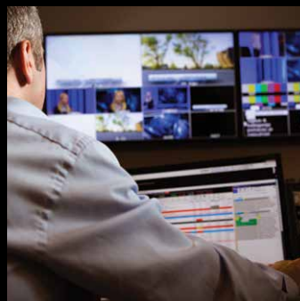
Conmutadores KVM 4K de sobremesa