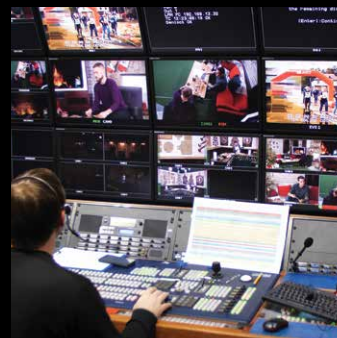
Controladores de videowall